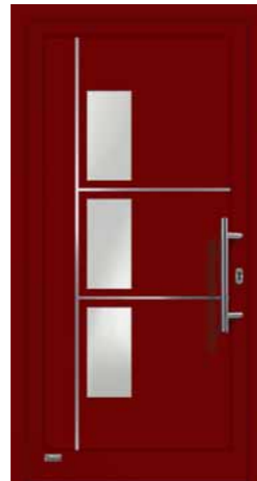
Haustürmodell „VIONA-Lisene 109“, Glas VSG matt