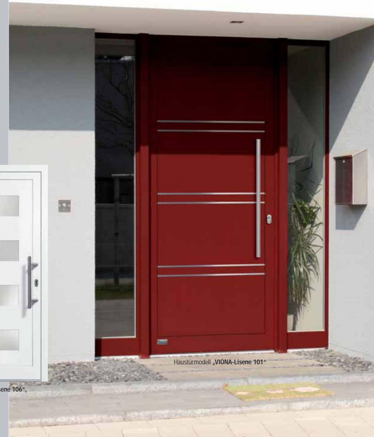
Haustürmodell „VIONA-Lisene 101“