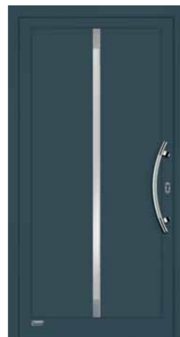
Haustürmodell „VIONA-Lisene 105“, Glas VSG matt