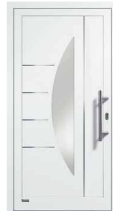
Haustürmodell „VIONA-Lisene 111“, Glas VSG matt