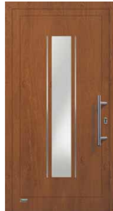
Haustürmodell „VIONA-Lisene 104“, Glas VSG matt