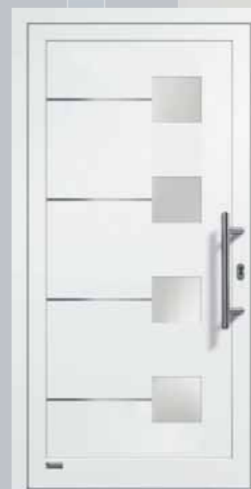
Haustürmodell VIONA-Lisene 106“, Glas VSG matt