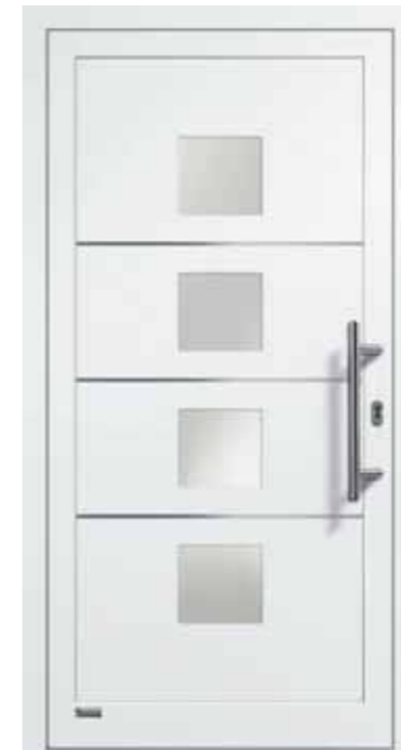
Haustürmodell „VIONA-Lisene 103“, Glas VSG matt