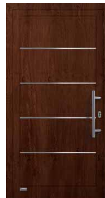
Haustürmodell „VIONA-Lisene 102“, Glas VSG matt