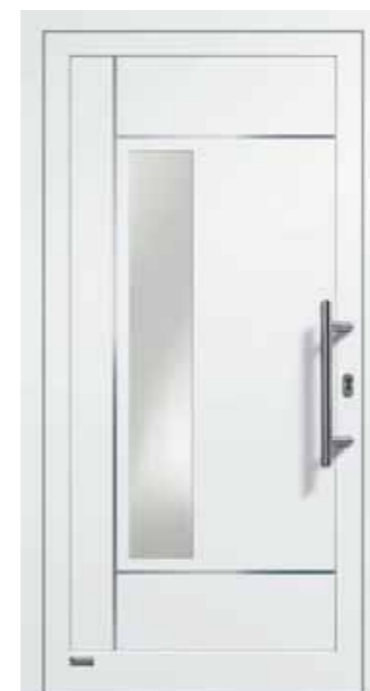
Haustürmodell „VIONA-Lisene 108“, Glas VSG matt