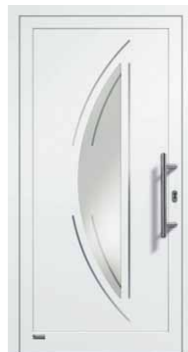
Haustürmodell „VIONA-Lisene 107“, Designglas Nr. 12 und VSG