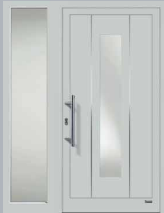
Haustürmodell „VIONA-Lisene 110“, Glas VSG matt

Haustüren sind statistisch gesehen die Bauteile, die am längsten im Baukörper verbleiben. Umso wichtiger ist es, dass Ihre Haustür nicht nur besonders langlebig ist, sondern auch genau Ihrem Geschmack entspricht.